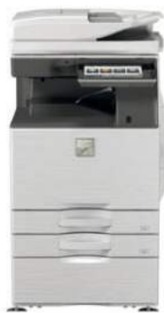
MX-4060N - Unità base Vassoio uscita carta Stand con cassetto da 550 fogli