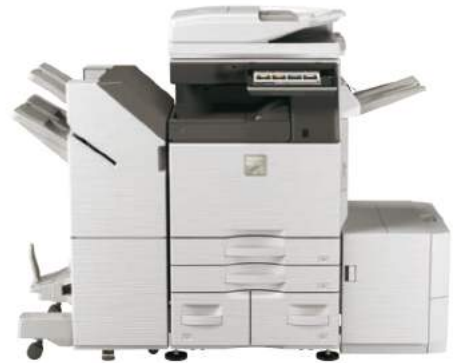
MX-4060N - Unità base Stand con cassetto da 550 fogli + 1 cassetto da 900 fogli + 1 cassetto da 1.200 fogli Finisher con pinzatura a sella + Unità di passaggio carta Vassoio uscita superiore Cassetto grande capacità