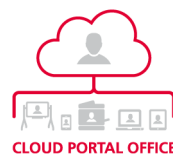
MFP CLOUD READY E OPTIMIZED SOFTWARE SOLUTION