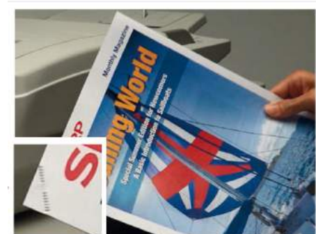
LA PINZATURA SENZA PUNTI È POSSIBILE FINO A 5 FOGLI