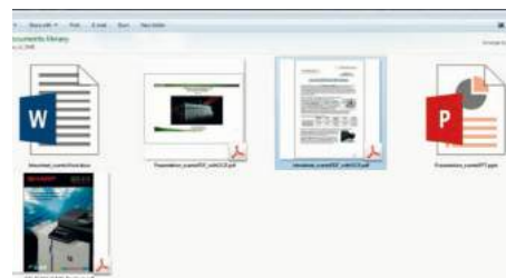
CON OCR CONVERTI I FILE SCANSIONATI IN FILE OFFICE MODIFICABILI E PDF RICERCABILI