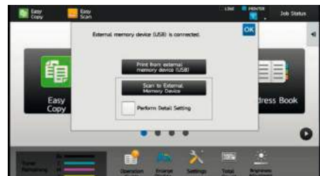
INSERISCI LA TUA PENNA USB NELLA MFP E INIZIA A STAMPARE