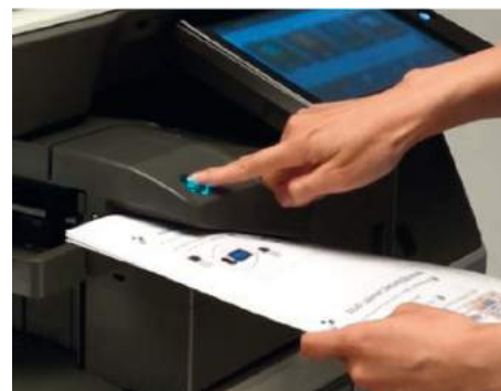
PINZATURA MANUALE FINO A 40 FOGLI (80 GR)