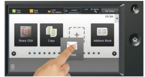
LA HOME PAGE DEL DISPLAY CON UNA FACILE PERSONALIZZAZIONE TOUCH

Le Optimised Mobile Solution consentono di connettere tablet, smartphone, laptop facilmente e in sicurezza, così da essere sempre connesse e collegate. Tutto questo ti permetterà di ottimizzare la produttività dei tuoi collaboratori e di incrementare la tua profittabilità.