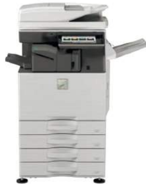
MX-4060N - Unità base Finisher interno Stand con 3 cassette da 550 fogli Vassoio uscita carta